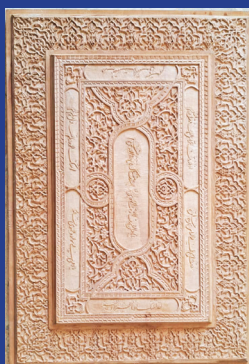
هنرمند: مریم کشتکاروندی رشته: صنایع دستی چوبی و حصیری شهر: کرج