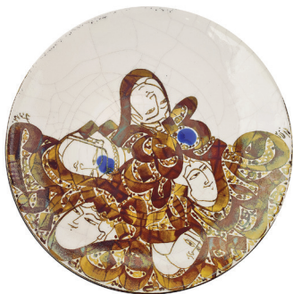
هنرمند: بهروز زیندشتی رشته: کاشی سنتی، سفال و سرامیک شهر: تهران