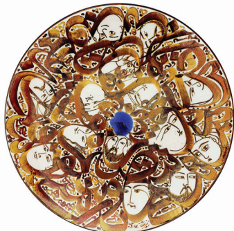
هنرمند: بهروز زیندشتی رشته: کاشی سنتی، سفال و سرامیک شهر: تهران