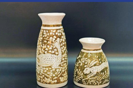
هنرمند: زهرا اصلانی رشته: کاشی سنتی، سفال و سرامیک شهر: اردبیل