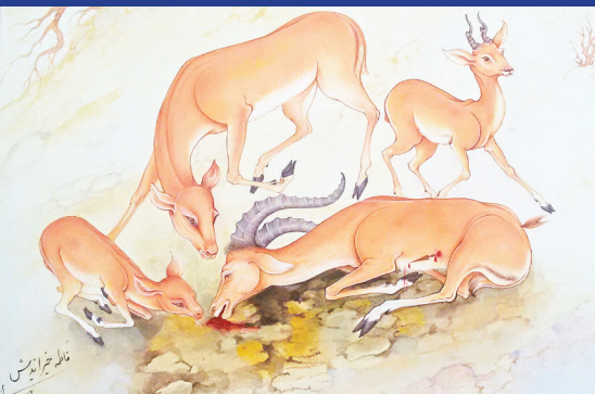
هنرمند: فاطمه خیراندیش رشته: طراحی و نقاشی سنتی شهر: کاشان