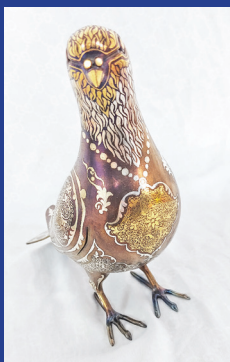
هنرمند: عبدالقیوم بیانی