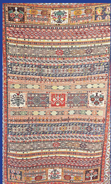
هنرمند: رودابه بابائی