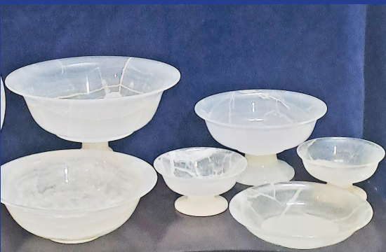
هنرمند: امیرعباس میرزاخانی رشته: صنایع دستی سنگی شهر: نیمور