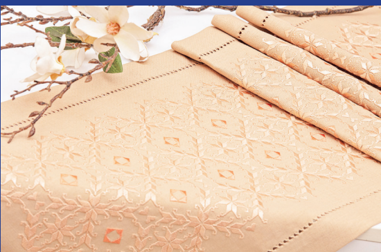
هنرمند: زهرا میری رشته: رودوزی‌های سنتی شهر: زابل