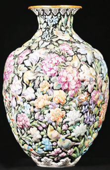
هنرمند: احسان صفایی رشته: میناکاری شهر: اصفهان