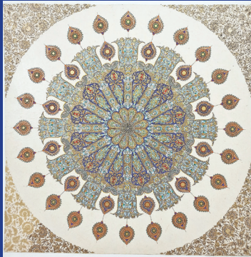
هنرمند: مهدی ظهرابی رشته: طراحی و نقاشی سنتی شهر: شیراز