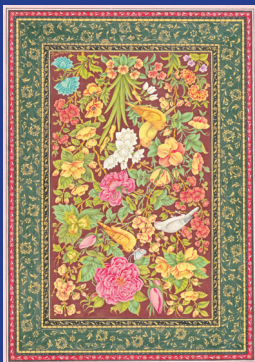
هنرمند: آزاده شوش پور رشته: طراحی و نقاشی سنتی شهر: تهران