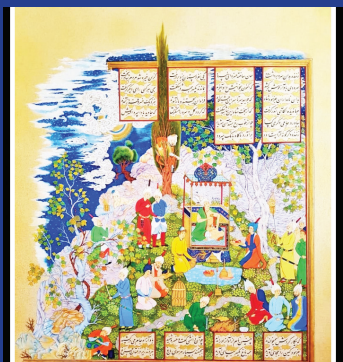
« هنرمند: زهره فیض‌اللهی « رشته: طراحی و نقاشی سنتی « شهر: اصفهان