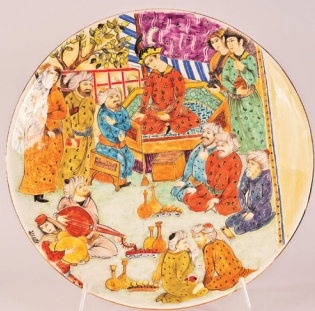
هنرمند: زهرا اصلانی