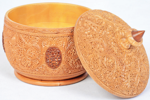
هنرمند: حمیدرضا عمادی