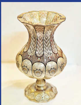
هنرمند: رضا زارع