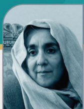
نورماروکسانا آماریا Noruma Roksanā Amariya

9th Fajr International Festival of Handicrafts Saru-e Simin (سرو سیمین) 20-24 February 2025 ۲۰-۲۴ اسفند ۱۴۰۳ Tehran - Iran