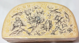
هنرمند: سمیه سادات افشاری چمک رشته: سازهای سنتی شهر: اصفهان