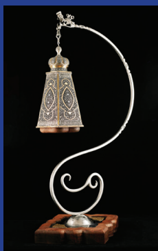
هنرمند: زینب صفاهانی عمروآبادی رشته: صنایع دستی فلزی شهر: اصفهان