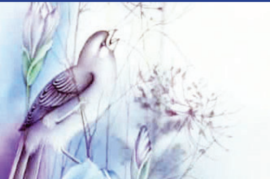
هنرمند: مهناز پاکزاد دستجردی رشته: طراحی و نقاشی سنتی شهر: اصفهان