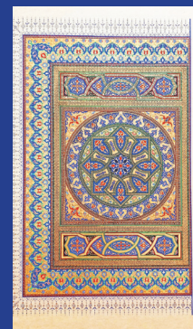
هنرمند: راحله جمالی رشته: طراحی و نقاشی سنتی شهر: بوشهر