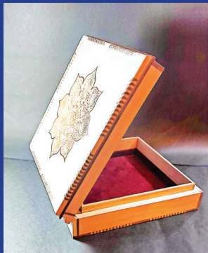
هنرمند: معصومه قاسمی زاده رشته: صنایع دستی چوبی و حصیری شهر: آباده