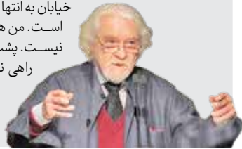
به پنهان زادروز داریوش شایگان؛ فیلسوف، هندی‌شناس، نویسنده و شاعر

من هر روز صبح که از خواب بیدار می‌شوم به این می‌اندیشم چرا زنده‌ام؟ و فکری می‌کنم این یک معجزه است که دوباره بیدار شده‌ام. فکری می‌کنم زندگی‌ام پرو کامل بوده و من دیگر از دنیا طلب ندارم و هر چه را می‌خواستم گرفته‌ام، می‌دانم که خیلی‌ها از زندگی و دنیا طلبکارند، از آن کینه دارند و دلخونند... این بیماری در روشنفکران زیاد است، اما من خوشبختانه به آن مبتلا نیستم. هرچه جلوتر می‌روید، خیابان پشت سر، طولانی‌تر می‌شود و خیابان روبه‌رو کوتاه‌تر. به جایی می‌رسید که مقابل‌تان فقط یک افق وجود دارد. خیابان به انتها می‌رسد و پشت سرش یک خیابان دور و دراز است. من هم به جایی رسیده‌ام که روبه‌رویم دیگر خیابانی نیست. پشت سرم خیابان طولی است اما روبه‌رویم دیگر راهی نیست.