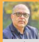
جعفر گولیزی رئیس انجمن منتقدان سینمای ایران

عصیانگر و در عین حال واقعی و باورپذیر، مردی است که ابتدا در حاشیه‌های واقعی زیست می‌کند، اما به‌مرور درگیر حاشیه‌های رسانه‌ای می‌شود. او موفق می‌شود سردرگمی و آسیب‌پذیری فردی را که ناخواسته به یک پدیده مجازی بدل شده، با اجرایی چندلایه نمایش دهد. صدف اسپهبدی، بازی‌اش ترکیبی از جاه‌طلبی، شکندگی و سرکشی است. بازی او جذابیت، قدرت و خلاقیت را با هوشمندی به اجرا در می‌آورد. «گوزن‌های اتوبان» فیلمی که به‌درستی مسخ‌شدگی نسل جدید را در دنیای نمایش محور نشان می‌دهد، اما در نهایت، آیا صرفاً به نمایش این بحران بسنده می‌کند؟ آیا فیلم فقط می‌خواهد