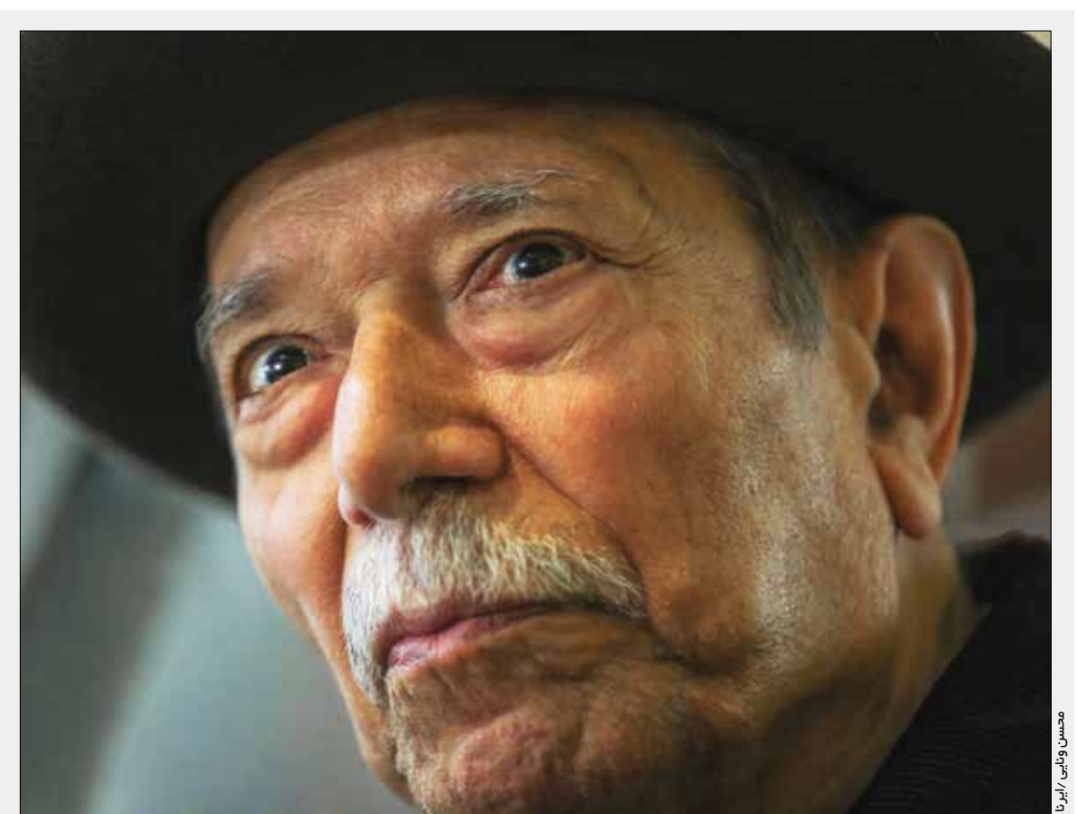
محسن وکالی / ایران

جشن روزنامه ایران به مناسبت سالروز تولد علی نصیریان