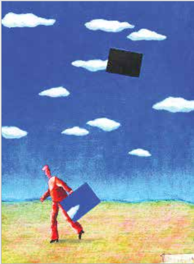
طراح: گرهارد جپ