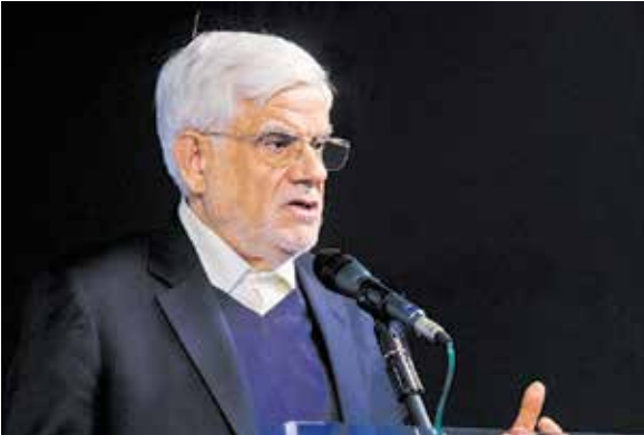
محمدرضا عارف در گفت‌وگو با یکتا

است، دیگر انسان نیست. مزیت انسان همین است. این کار انسان، بدون اینکه تلقی فرصت‌طلبی شود، سازگاری با موقعیت است. اصلاح‌طلبان از این ویژگی برخوردار بودند. در گذشته هم این‌گونه بوده است. در دولت آقای روحانی، اصلاح‌طلبان خیلی خوب راه آمدند. البته جواب هم نگرفتند. یعنی در ۸ سال دولت تدبیر و امید، اصلاح‌طلبان سنگ تمام گذاشتند. در مجلس دهم، ما تمام حیثیت‌مان را برای دولت تدبیر و امید گذاشتیم، اما هیچ اتفاقی نیفتاد.