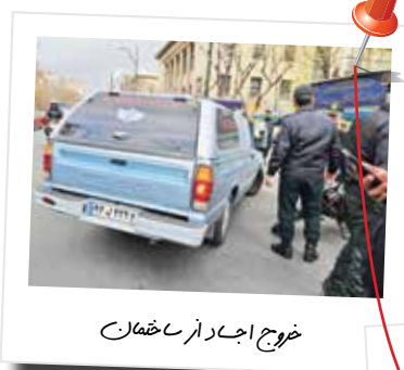
خروج اجبار از ساختمان