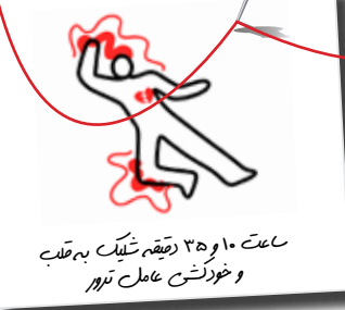
ساعت ۳:۵۱ دقیقه شلیک به قاضی و خورشید عامل ترور