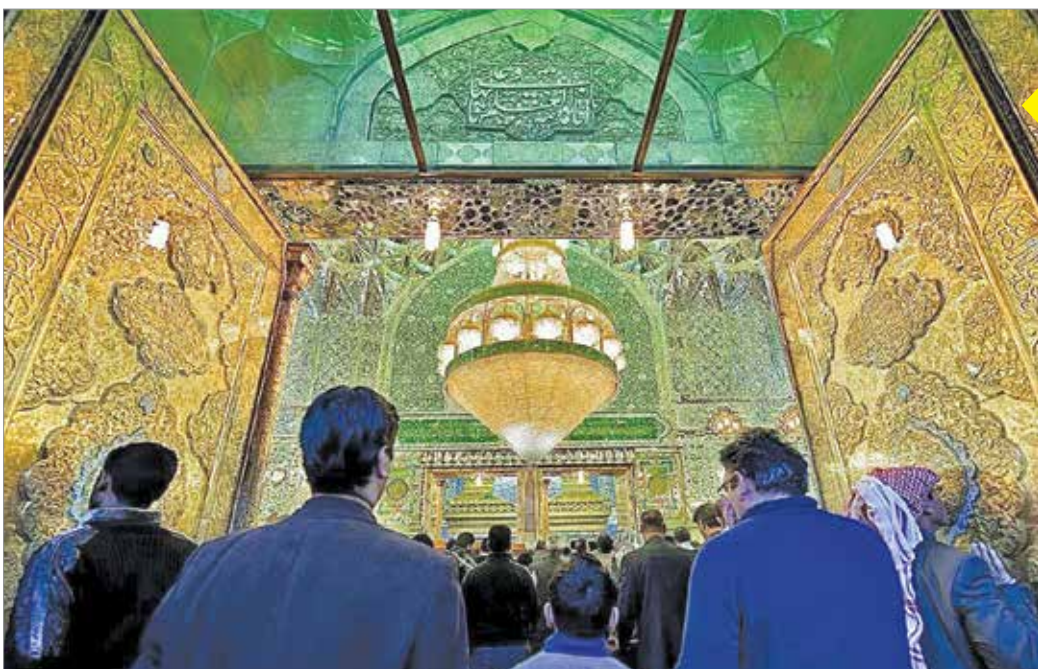
بارگاه ملکوتی امیرمؤمنان علی (ع) پیشوای بزرگ جهان اسلام و امام اول شیعیان در نجف اشرف همزمان با سیزدهم رجب؛ ولادت آن حضرت روز پدر حال و هوای خاصی پیدا کرد.