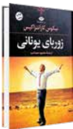
زوزای یونانی نیکیوس کاراندراکیس

علت اینکه دنیا به چنین وضع اسفناکی افتاده این است که همه کارشان را نیمه‌کاره انجام می‌دهند. افکارشان را نیمه‌کاره بیان می‌کنند و گناهکار یا پرهیزگار بودنشان هم نیمه‌کاره است. تا آخر برو و نترس.