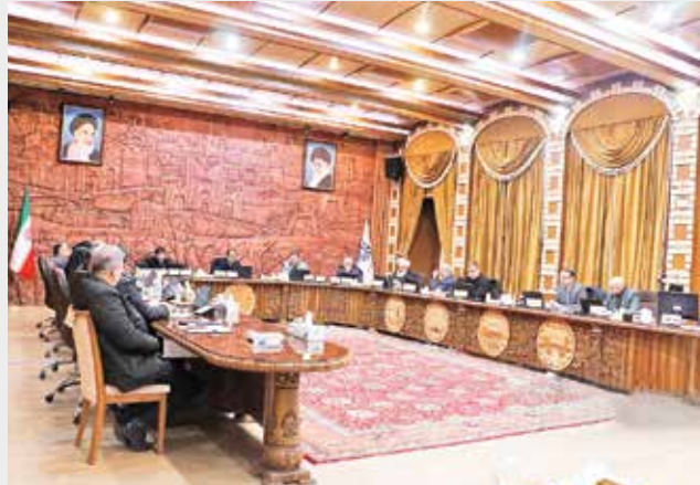
جلسه شورای اسلامی تبریز

نظارتی مانند سازمان بازرسی و... به موضوع باز شده و عمر شهردار این زمین موفق نمی شوند، چرا که استیضاح شهرداران به کسب دو سوم آرای شورای شهر نیازمند است و در صورت لابی شهردار با یک سوم باقی مانده، خود را از گائله استیضاح و برکناری نجات می دهد. با این حال تخصص و تجربه شهرداران در امور مدیریت شهری، فشار اعضای شورای شهر و احتمال استیضاح و برکناری را به حداقل رسانده و متوسط عمر شهرداران را افزایش خواهد داد.