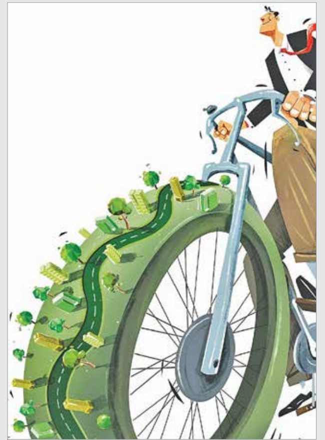
طراح: سومیا دیپ‌شینها