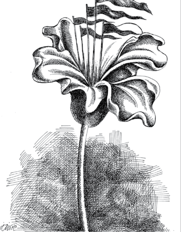
طراح: محسن توری نجفی