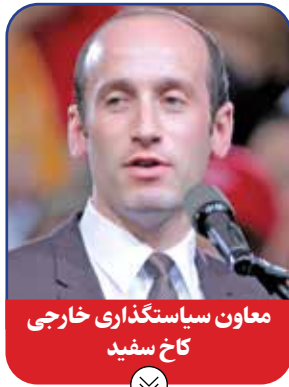
معاون سیاست‌گذاری خارجی کاخ سفید

مهم‌ترین مشخصه زلدین لاقلا از دیدگاه ترامپ، حمایت تمام‌عیار زلدین از او طی سال‌های اخیر است و گفته این نماینده ۴۴ ساله کنگره آمریکا هیچ پیشینه‌ای در امور «زیست محیطی» ندارد. ترامپ از زلدین خواسته است همسو با سیاست‌های انتخابی او برای کاستن از آلودگی هوا و مصرف بی‌رویه سوخت‌های مختلف در راه تأمین انرژی کارخانه‌ها و منازل در آمریکا، هرگونه عنصر آلوده‌کننده محیط زیست را محو کند. ترامپ همچنین به زلدین گفته است پویاسازی صنایع آمریکا و پیوسته صنعت بسیار پرسود اتومبیل‌سازی را به گونه‌ای صورت دهد که از خراب‌تر شدن محیط‌زیست آمریکا جلوگیری کند و مانع از افزایش انتقادهای جهانی از این کشور در این زمینه شود.