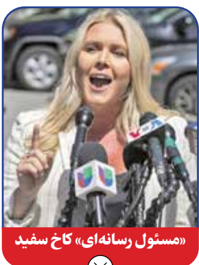
«مستول رسانه‌ای» کاخ سفید

این زن سیاستمدار در اصل عضو حزب دموکرات بود و با گروه‌های مستقل و ترقی خواه این حزب شامل برنی سندرز همسویی نشان می‌داد و از او در انتخابات ریاست جمهوری سال ۲۰۱۶ حمایت کرد؛ ولی سندرز از عهده هیلاری کلینتون برنیامد و در نهایت کلینتون نماینده دموکرات‌ها در این انتخابات شد. کبارد از سال ۲۰۲۲ تغییر موضع داد و به جمهوریخواهان پیوست و از ماه اگوست (سرداد) این سال تصریح کرد که در انتخابات ریاست جمهوری از ترامپ حمایت می‌کند. کبارد در این پست بر سازمان‌های اطلاعاتی آمریکا مثل سی‌آی‌ا، اف‌بی‌آی و سازمان امنیت ملی (ان‌اس‌ا) که وظیفه آن جمع‌آوری اطلاعات امنیتی است تمرکز خواهد داشت. اگر او رأی اعتماد بگیرد سال به وضوح می‌شود در فرآیند انتخابات امسال روایت کرد.