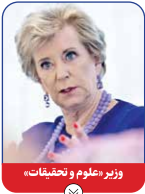
وزیر «علوم و تحقیقات»

آلینا حبه وکیل دعاوی و یک حقوقدان زن است که طی سال‌های اخیر در دعاوی قضایی متعددی که ترامپ درگیر آن بوده، از وی دفاع کرده و از صدور بعضی احکام تند علیه او جلوگیری کرده است. ترامپ با تأکید بر کمک‌های بی‌دریغ قضایی وی را فردی نامیده که طی سال‌های متعددی در سخت‌ترین برنده‌ها حضور یافته و او را از گذرگاه‌های سخت عبور داده است. حبه با کسب عنوان مشاور ترامپ در دوره جدید زمامداری وی به واقع پادشاه حضور بی‌وقفه‌اش را در حلقه وفاداران به او دریافت کرده است. حبه از سال ۲۰۲۱ و بعد از آن که طبق روایت‌ها، آقای ترامپ را در کلوب خارج شهرش، در بدمنستر نیوجرسی به واقع گزیننده‌های فزون‌تری را در زمینه‌های تحصیلی پیش رو داشته باشند.