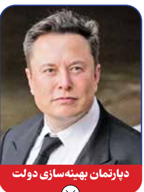
دبیرتمان بهینه‌سازی دولت

بورگام با استفاده از ثروتی که در دوران اشتغالش در حرفه تولید نرم‌افزارهای تکنولوژیکی کسب کرده بود، خیل مردم را با اهدای هدیه‌های مالی یک میلیون دلاری به رأی دادن به خود در انتخابات امسال تشویق کرد ولی این روش نمری نبخشید. بورگام از دسامبر ۲۰۲۳ به اردوی ترامپ پیوست ولی برخی اقدامات او در زمان تصدی پست فرماندار داکوتای جنوبی از جمله افزایش حجم استخراج نفت از معادن این منطقه، بازخورد مثبتی در این ایالت و جامعه آمریکا نداشت. با این حال ترامپ در زمان معرفی بورگام به عنوان نامزد احراز پست وزیر کشور او را فردی حرفه‌ای و توانمند برای تشکیل شورایی تازه که کل منابع انرژی را در این کشور مدیریت کند و بر چگونگی تولید و استفاده از نفت و گاز نظارت مؤثر داشته باشد، نقشی موفق را ایفا کند.