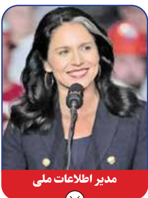
مدیر اطلاعات ملی

به اعتقاد این گروه، اعلام آتش بس بین اسرائیل و لبنان پس از دو ماه حملات هوایی شدید رژیم صهیونیستی به بیروت و چند نقطه دیگر در جنوب لبنان نیز نشانه مستقیم و صریح طرز نگاهی است که ترامپ از این پس بودجه‌ای ۲۰ میلیارد دلاری برای ۱۸ سازمان بولوس پایه‌گذار آن است.