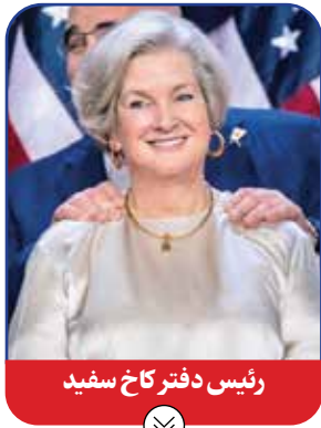
رئیس دفتر کاخ سفید

در مقطع اول زمامداری ترامپ در آمریکا، مک‌مان مسئول بخشی از دولت بود که «مجمع حرفه‌های کوچک» نامیده می‌شد. مک‌مان دو بار هم کوشیده است به عضویت مجلس سنا درآید و نماینده ایالت گانه‌تیکات در این مجلس شود اما تلاش‌هایش بی‌نتیجه ماند است. ترامپ برای رونالد ریگان، رئیس جمهوری آن زمان آمریکا هم فعالیت‌های تبلیغاتی انجام می‌داد. او در ۲۰۱۸ به «ران دوستانتیز» کمک کرد تا فرماندار فلوریدا شود اما در انتخابات درون حزبی جمهوری خواهان برای رقابت‌های ۲۰۲۴ ترامپ را چنان پر و پیمان به میدان فرستاد که دوستانتیز بعد از پذیرفتن شکستی یکطرفه مقابل ترامپ در همان ایستگاه اول از خیر ادامه کار گذشت و به کلی انصراف داد.