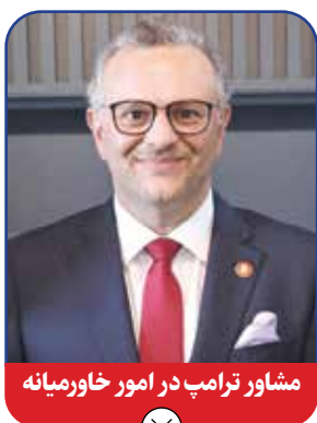
مشاور ترامپ در امور خاورمیانه

سبزه روز دیگر، دونالد ترامپ بار دیگر به کاخ سفید بازمی‌گردد تا بعد از «گروور کلیوند» دومین رئیس جمهوری در تاریخ آمریکا لقب بگیرد که پس از وقفه‌ای ۴ ساله به کاخ سفید بازمی‌گردد. مؤسس ترامپسیسم، با تجربه دوره قبل خود این بار آماده است تا مرزهای قدرت و قانون را به چالش بکشد و برای این هدف حلقه‌ای از وفاداران را دور خود جمع کرده است. علاقه‌مندی که بیش از اینکه تابع حزب جمهوری خواه و ساختارهای رسمی قدرت باشند، پیروی کامل از امیال رئیس جمهوری، میثاق آنها در دولت دوم ترامپ خواهد بود. ترامپ توانسته سیاست ایالات متحده را بازتعریف کند. سه انتخاباتی که ترامپ در آنها شرکت کرده - در سال‌های ۲۰۱۶، ۲۰۲۰ و ۲۰۲۴ - دوران جدیدی از سیاست را ارائه می‌کنند: دوره‌ای که با نام پوپولیسم محافظه کارانه دونالد ترامپ تعریف می‌شود. به نوشته نیویورک تایمز تا قبل از ترامپ، چیزهای زیادی در مورد سیاست آمریکا وجود داشت که می‌شد آنها را بدیهی فرض کرد. معنای دو طرف (دوقطبی) جمهوری خواه - دموکرات) روشن به نظر می‌رسید. جمهوری خواهان نماینده چهار شاخص محافظه‌کاری اقتصادی، دولت کوچک، راست کیسی مذهبی و شاهین‌های سیاست خارجی رنگینی بودند. دموکرات‌ها نیز نماینده طبقه کارگر، تغییرات اجتماعی و جنبش‌های لیبرالی بودند. اما با ورود ترامپ به صحنه، همه چیز تغییر کرد. به نظر می‌رسد که دو حزب جایگاه خود را