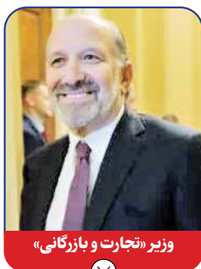
وزیر «تجارت و بازرگانی»

ترامپ گفته است: «ماسک و راماسوامی با تکیه بر اطلاعاتی که از عوامل آگاه غیردولتی کسب خواهند کرد، به دولت در راه رفع ناترازی‌ها و حذف مخارج هنگفت امور بوروکراتیک یاری خواهند رساند.» ماسک در دوران فعالیت‌های انتخاباتی ترامپ برای بازگشت به کاخ سفید مبالغ فراوانی را در این راه خرج کرد. ماسک در ابتدا منتقد ترامپ بود اما طی سال ۲۰۲۴ به آرامی تغییر موضع داد. راماسوامی نیز از جمله جمهوریخواهانی بود که در انتخابات درون حزبی آنها به رقابت با ترامپ برخاست ولی به محض دیدن اقتدار این حریف پوپولیست و معزز نشان دادن شکستش از ادامه رهش صرف نظر و اعلام انصراف کرد تا توان و وقتش را در حالی که مصرف انتخابات بعدی (۲۰۲۸) کند.