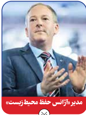
مدیر «آژانس حفظ محیط زیست»

دافی که پیشینه عضویت در کنگره آمریکا را به عنوان نماینده ایالت ویسکانسین دارد از دیدگاه ترامپ می‌تواند ساختار کهنه شده حمل‌ونقل در آمریکا را بازسازی و مدرن سازد. دافی پس از آشنا شدن با ترامپ که در زمینه گارهای تبلیغاتی و رسانه‌ای یک استاد است، روند ارتقای خود را شدت بخشید. با این حال دافی توصیه ترامپ را در این مورد که برای کسب عنوان فرمانداری ویسکانسین در انتخابات با آن شرکت کند، نادیده گرفت و ترجیح داد خانواده پر عائله خود را مدیریت کند. او در مرتبه اولی که خواستار راهیابی به کنگره آمریکا شد، به مردم گفت که از خانواده‌های کارگری می‌آید و اهل تیر و تیشه است و افزود اگر به عضویت کنگره درآید، تیر خود را نیز به آتش خواهد برد!