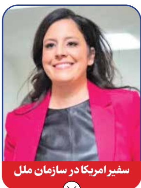
سفیر آمریکا در سازمان ملل

له‌ویت فقط با ۲۷ سال سن تبدیل به جوان‌ترین سخنگوی تاریخ کاخ سفید آمریکا بوده و ۱۰ سال است که در این نهاد فعالیت می‌کند. او در شکل‌گیری اقدامات اخیر کنگره برای کنترل آنچه «رویکردهای ضدیهودی» در کمپ‌های دانشجویی آمریکا نامیده شد، نقشی پیشرو داشت و این رویداد منجر به ناآرامی‌های زیادی در این کمپ‌ها و ضرب و شتم دانشجویان و اساتید دانشگاه‌ها شد که از فلسطینی‌ها به سبب مشقت‌های تحمیل شده به آنها حمایت کرده و خواستار تأدیب اسرائیلی‌ها شده‌اند. استفتانیک در شرایطی در سازمان ملل مستقر می‌شود که بحث‌های مربوط به جنگ غزه و جنگ اوکراین که رد پای آمریکا در هر دو آنها شدت محسوس است، به اصلی‌ترین مسائل جهان تبدیل شده است.