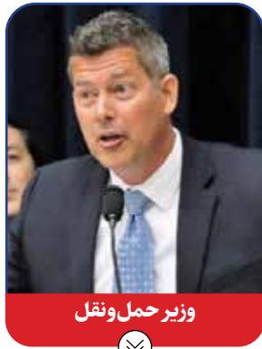
وزیر حمل و نقل

وایلز ۶۷ ساله مشاور ارشد ترامپ در کمپین انتخاباتی امسال وی بود و بسیاری او را معمار پیروزی قاطع ترامپ در برابر کنگره آمریکا می‌دانند. وایلز آنقدر با تجربه است که در دهه ۱۹۸۰ برای رونالد ریگان، رئیس جمهوری آن زمان آمریکا هم فعالیت‌های تبلیغاتی انجام می‌داد. او در ۲۰۱۸ به «ران دوستانتیز» کمک کرد تا فرماندار فلوریدا شود اما در انتخابات درون حزبی جمهوری خواهان برای رقابت‌های ۲۰۲۴ ترامپ را چنان پر و پیمان به میدان فرستاد که دوستانتیز بعد از پذیرفتن شکستی یکطرفه مقابل ترامپ در همان ایستگاه اول از خیر ادامه کار گذشت و به کلی انصراف داد.