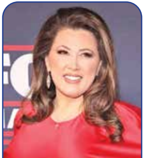
بزشک قانونی کل کشور

ترامپ با انتخاب ساکس و مستقر کردن وی در کاخ سفید عملاً او را به عنوان مدیر عملیات هوشمند و مدرن سازی روش‌های حکومتی در دوره جدید زمامداری‌اش منصوب کرده است. ترامپ در متن حکم این انتصاب تأکید کرده که استفاده درست از هوش مصنوعی و ارزهای دیجیتال چه سهم سترگی در تدوین آینده کشورش خواهد داشت. با این حال چون ترامپ از پل تکنیز هم خواسته است که کمیسیون امنیتی ارتباطات دیجیتال را رهبری کند، مشخص نیست وظایف تکنیز و ساکس چگونه از یکدیگر تفکیک خواهد شد. ساکس در کمپانی‌های بزرگی مثل اسپیس ایکس، یوبرو و لانتیر نیز حضور و در تدوین طرح‌های مرتبط با ارزهای دیجیتال توسط این کمپانی‌ها شریک بوده است.