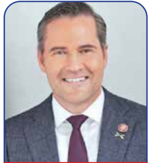
مشاور امنیت ملی

جیمز دیوید ونس که فرد منتخب دونالد ترامپ برای احراز پست معاون اوست، عضویت حزب جمهوری خواه را دارد و از سال ۲۰۲۳ به عنوان نماینده ایالت زادگاهش (واشینگتون) در مجلس سنای آمریکا حاضر بوده است. او با ۴۱ سال سن تبدیل به سومین معاون اول جوان در تاریخ حیات سیاسی آمریکا شده است و پیشینه حضور در نیروی دریایی این کشور را هم دارد. وی همچون ترامپ یک «دست راستی» پیوپولیست و طرفدار شدید اسرائیل است. ونس مخالف سقط جنین و موافق حمل سلاح توسط مردم عادی به بهانه حق دفاع آنها از جان شان است. وی مخالف ادامه تجهیز تسلیحاتی اوکراین در جنگ با روسیه است. محافل سیاسی واشنگتن معتقدند، در سال ۲۰۲۸ که ترامپ به سبب دو دوره حضور در کاخ سفید دیگر حق شرکت مجدد در انتخابات آمریکا را نخواهد داشت، ونس گزینه اول برای جانشینی وی خواهد بود.