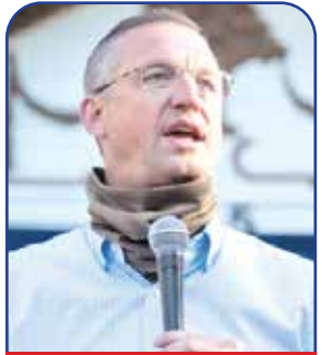
وزیر امور کهنه سربازان

پس از کنار کشیدن مت گانتز که به سبب سوابق سوء سیاسی‌اش امکان احراز این سمت را از دست داد، ترامپ این زن سیاستمدار ۵۹ ساله را برای این پست حساس برگزید. پم بوندی در سال ۲۰۱۰ با احراز پست فرمانداری ایالت فلوریدا به اولین زن در تاریخ حیات آمریکا تبدیل شد که حائز این سمت شده است. بوندی سال‌ها در مدار سیاست‌های مطلوب ترامپ قرار داشته و حتی در جریان کنوانسیون حزب جمهوریخواه در سال ۲۰۱۶ که ترامپ در آن رسماً به عنوان نماینده این حزب در انتخابات ریاست جمهوری برگزیده شد، به سخنرانی پرداخت و از این گزینش حمایت کرد. بوندی در اندیشه‌ها نازدهی که ترامپ به راه انداخته و عنوان «اول آمریکا» را برای آن برگزیده نیز فعالیت کرده و بخشی از اقدامات این اندیشه‌ها را در پیروزی ترامپ در انتخابات ۵ نوامبر ۲۰۲۴ بود.