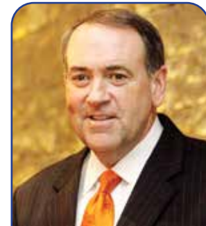
سفیر آمریکا در اسرائیل

ووگت در اواخر دوره اول ریاست جمهوری ترامپ نیز حائز این پست بود. او از طراحان و نویسندگان برنامه‌های اقتصادی رئیس جمهوری نشان می‌دهد چگونه می‌تواند شاخه‌های اجرایی سازمان آمریکا در جهت فعال بودن و نقش آن در یک تحول کامل مدیریتی در این نهاد شکل گیرد و بودجه موجود به بهترین شکل تقسیم و به کار گرفته شود. ووگت در تیم انتخاباتی ترامپ در سال ۲۰۲۴ نیز فعال و حاضر بود و همچنین کنوانسیون نهایی حزب جمهوریخواه را در ماه اگوست (مرداد) به سوی اعلام نام ترامپ به عنوان نامزد اصلی و نهایی این حزب برای انتخابات ریاست جمهوری سوق داد.