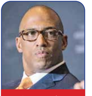
وزیر مسکن و توسعه شهری

در سال ۲۰۱۹ کمیته تحقیقات مجلس نمایندگان آمریکا درصدد جمع‌آوری اسنادی به قصد استیضاح و برکناری ترامپ بود که یک نماینده جمهوریخواه این مجلس واکنش تندی به این قضیه نشان داد و او داگ کالینز بود که از ایالت جنوبی جورجیا می‌آید. کالینز گفت: «من می‌پرسم که کمیته تحقیقات ما به چه دستاوردی رسیده و پاسخ این است که به نتیجه و گزارش دروغین.» ترامپ با یادآوری حمایت قاطع کالینز از خودش، او را برای مدیریت سازمان بانزستگان لشکری نامزد کرده است. ترامپ در پیام خود برای معرفی کالینز آورده است: «ما باید احترام سربازان و درجه‌داران ارتش خود را که بازنشسته شده‌اند، حفظ کنیم و از خانواده‌های آنان حمایت نماییم و کالینز بهترین گزینه برای انجام این مهم است. من فکر می‌کنم وجود او باعث تقویت جایگاه ارتشی‌های شغال نیز خواهد شد.»