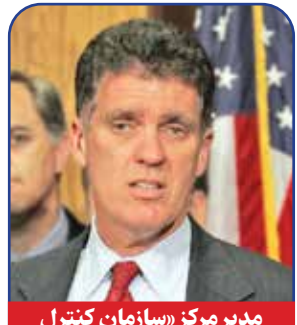
مدیر مرکز «سازمان کنترل کاهشی بیماری‌ها»

به اعتقاد ترامپ، ایجاد تسهیل در خریداری املاک و مستغلات سبب می‌شود که جرم و جرم و جنایت در جامعه هم کمتر شود. انتخاب ترنر برای این پست با هر نتیجه‌ای همراه شود، برای خود او یک عامل تبلیغی مهم و ارتقادهنده وی در سلسله مراتب سیاسی کشور است. ترنر از شهر ریچاردسون در ایالت تگزاس می‌آید و در رشته «فوتبال آمریکایی» به درجات بالایی رسید و در تیم‌های مطرحی همچون «واشینگتن رد اسکیتز» بازی کرد ولی بعداً به دنیای سیاست وارد شد و به عنوان نماینده ایالت تگزاس دو دوره متوالی در مجلس نمایندگان آمریکا انجام وظیفه کرد. در دوره اول ریاست جمهوری ترامپ نیز ترنر مدیریت واحدی به نام «فرمت‌سازی و احیای مشاغل» را درون تشکیلات کاخ سفید در اختیار داشت.