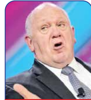
مدیرکل «نظارت‌های مرزی»

رایت، رئیس هیأت مدیره کمپانی تولید انرژی موسوم به «آزادی» بوده و تخصص این کمپانی دگرگون و متحول کردن روش‌های استخراج نفت و گاز از درون لایه‌های زیرزمینی با به‌کارگیری روش‌های انفجاری و تولید فشار انبوه روی سطح ضخیم معادن است. این در حالی است که متخصصان امور محیط زیست می‌گویند روش مذکور آب‌های زیرزمینی را مسموم و آلودگی محیطی را بیشتر می‌کند و در صورت استمرار در اجرای این روش‌ها خطر رانش زمین و وقوع زلزله‌ها هم افزایش می‌یابد. ترامپ بدون توجه به تذکرات فوق، رأیت را بابت اقداماتش در بیرون آوردن حجم هر چه بیشتری از نفت و گاز مدفون در دل زمین سپرده و گفته است: «رأیت یکی از پیشگامان انقلاب در روش‌های کشف و ذخیره‌سازی منابع مختلف انرژی در کشورمان بوده و از این حیث ما را از رویکرد به منابع سایر کشورها بی‌نیاز کرده است.»