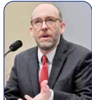
مدیر دفتر مدیریت و بودجه

ولدون ۷۱ ساله یک پزشک و در عین حال نظامی پرسابقه است که در قامت یک جمهوریخواه هفت دوره در مجلس نمایندگان آمریکا عضویت یافت. انتخاب شدن او برای پست «سازمان کنترل بیماری‌ها» بازکننده راه وی برای بازگشت به قطب سیاست آمریکا است، سوءا اعتمادی را که قاطبه مردم آمریکا به این سازمان دارند و قصورها در این زمینه را فراوان می‌دانند، معمو و اعتماد را جانشین آن کند. ترامپ گفته است: «ولدون سابقه یک زندگی ژانوشویی موفق را به مدت ۴۵ سال دارد و صاحب دوفرنده هم هست و در نتیجه به اهمیت فراوان عنصر خانواده و نقش آن در ساخت جوامع سالم واقف است و به این ترتیب هر چه را که در این راه الزامی است، فراهم خواهد آورد.»