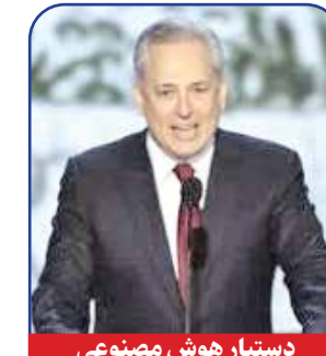
دستیار هوش مصنوعی و تکنولوژی نوین

لوفلر سابقه حضور در مجلس سنای آمریکا را در سال‌های ۲۰۲۰ و ۲۰۲۱ دارد. ترامپ در بیانیه‌ای که درخصوص انتخاب لوفلر منتشر کرده، آورده است: «لوفلر این توان را دارد که صنایع کوچک و حرفه‌های خرد کشور را مدیریت و آنها را به درجات بالاتری از بهره‌دهی برساند. دیگر وظیفه او، برچیدن بساط رشوه‌گیری در سازمان صنایع خرد و جلوگیری از خرج‌های غیرضروری در این نهاد است، به گونه‌ای که همه فعالیت‌های اقتصادی صنایع کوچک یا کمترین بودجه و بدون نیاز آنها به وام‌های دولتی صورت پذیرد. لوفلر در سال ۲۰۲۰ که ترامپ در انتخابات ریاست جمهوری مقابل جو بایدن بازنده اعلام شد، جزو گروهی بود که کوشید وقوع تقلب را در این انتخابات اثبات کند.