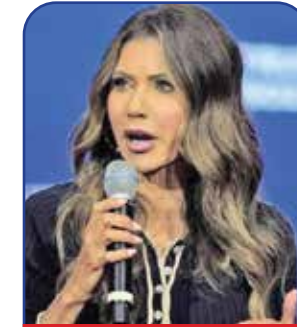
وزیر امنیت داخلی

ترامپ در روز معرفی هومن به عنوان مسئول ارشد کنترل‌های مرزی، وی را «سززار مرزی» نامید و گفت، هیچ‌کس بهتر از او نمی‌تواند امنیت را بر مرزهای وسیع مشترک آمریکا با سایر کشورها و پویتر مکزیک برقرار کند. در دوره اول (۲۰۱۶ تا ۲۰۲۰) ریاست جمهوری ترامپ نیز هومن در کابینه وی حضور داشت و مدیر دیپارتمان امور مهاجران و امنیت مرزی آمریکا بود و همواره گفته می‌شد که او بهتر از هر کسی می‌تواند مهاجران غیرقانونی را به کشورهای خود و نقاط مبدأ سفرشان برگرداند. ترامپ این بار هم خواب‌های مفصلی را برای هومن دیده، زیرا می‌خواهد به دیپورت‌های پناجویان غیرقانونی از خاک آمریکا دست بزند و میلیون‌ها تبعه خارجی را که اسناد اقامتی‌شان معتبر نیست، از این کشور بیرون کند.