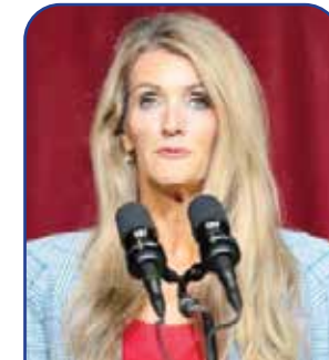
مدیر دفتر کسب و کارهای خرد

هاگابی فرماندار سابق ایالت آرکانزاس است که پیشینه شرکت در انتخابات ریاست جمهوری آمریکا را هم دارد و همیشه طرفدار سرسخت اسرائیل بوده است. ترامپ بر همین اساس برای انتصاب هاگابی به عنوان سفیر آمریکا در تل‌آویو حساب کرده و گفته است: «هاگابی، اسرائیل را دوست دارد و اسرائیلی‌ها هم به او علاقه‌مند هستند و چه کسی بهتر از وی برای احراز این سمت؟ هاگابی طی فعالیت‌های سیاسی‌اش بارها به سرزمین‌های اشغالی سفر کرده و کوشیده مواضع مقامات تل‌آویو در این مناطق را تقویت کند. هاگابی حتی قبول ندارد که باریکه غزه و کرانه غربی متعلق به فلسطینی‌هاست و آنها را مایکل اسرائیل نامیده است!