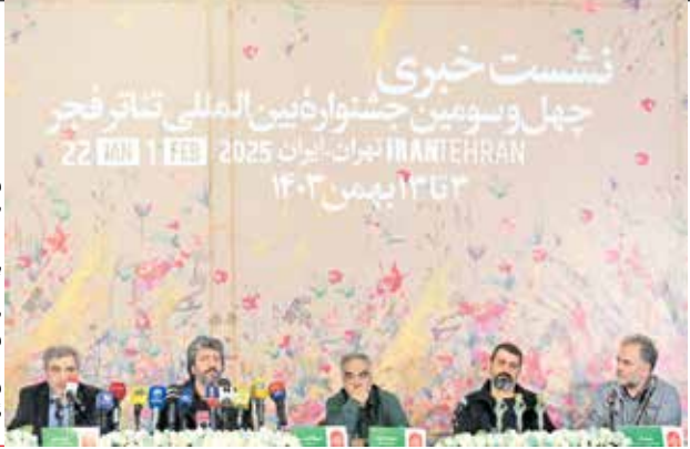
رضا معظیان (رائیس مجلس ایران)

انتخاب شد و به مرحله نهایی رسیدیم که در ادامه ۱۲ اثر به عنوان نامزدهای نهایی معرفی شدند. لازم به ذکر است بخش‌های خاص جشنواره مانند مقاومت، غزه، نگارش نمایشنامه براساس زندگی و فعالیت‌های همزمان ملی به این دلیل که معیار سنجش آنها متفاوت است در فهرست نامزدها قرار ندارند.