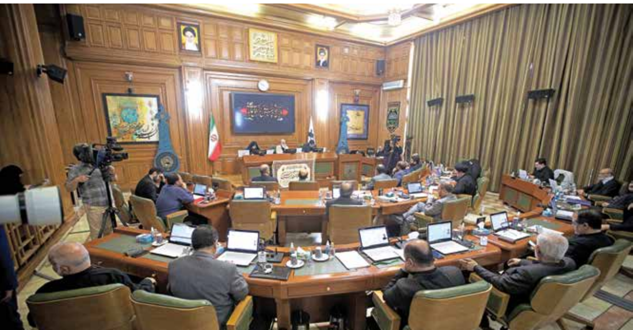
رئیس شورای عالی استان‌ها در جلسه شورای عالی استان‌ها

رئیس شورای عالی استان‌ها در گفت‌وگو با «ایران»، چالش‌های پیش‌رو در ساختار مدیریت شهری را تشریح کرد