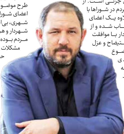
این موضوع قبلاً در مجلس هم مطرح شده؟ تا جایی که بنده اطلاع دارم، وزارت کشور این موضوع را قبلاً پیگیری کرده و پس از طرح آن در هیأت دولت، رد شده است. بنابراین باید به قوانین پایبند بوده و بر اساس آن طرح‌ها و لایحه‌ها آماده کنیم. لذا هر آنچه که نمایندگان مجلس درباره آن تصمیم‌گیری کرده و آن را تبدیل به قانون کنند، قابل احترام بوده و باید آن را اجرا کرد.

شکی نیست که بنا به روزرسانی قوانین و همراه و همخوان کردن آن با شرایط موجود، وضعیت بهتر خواهد شد. البته از نظر بنده، قانون در یک مورد دارای اشکال جزئی است. از طرفی منتخب مردم در شوراها با آرای نصف به علاوه یک اعضای شورای شهر، انتخاب شده و از سویی دیگر، شهردار با موافقت دو سوم اعضا، استیضاح و عزل می‌شود. این موضوع شرایط بهره‌مندی و استفاده بهینه شهردار از شرایط موجود و اختلافات فی‌مابین اعضا را با چالش‌های جدی مواجه کرده است.