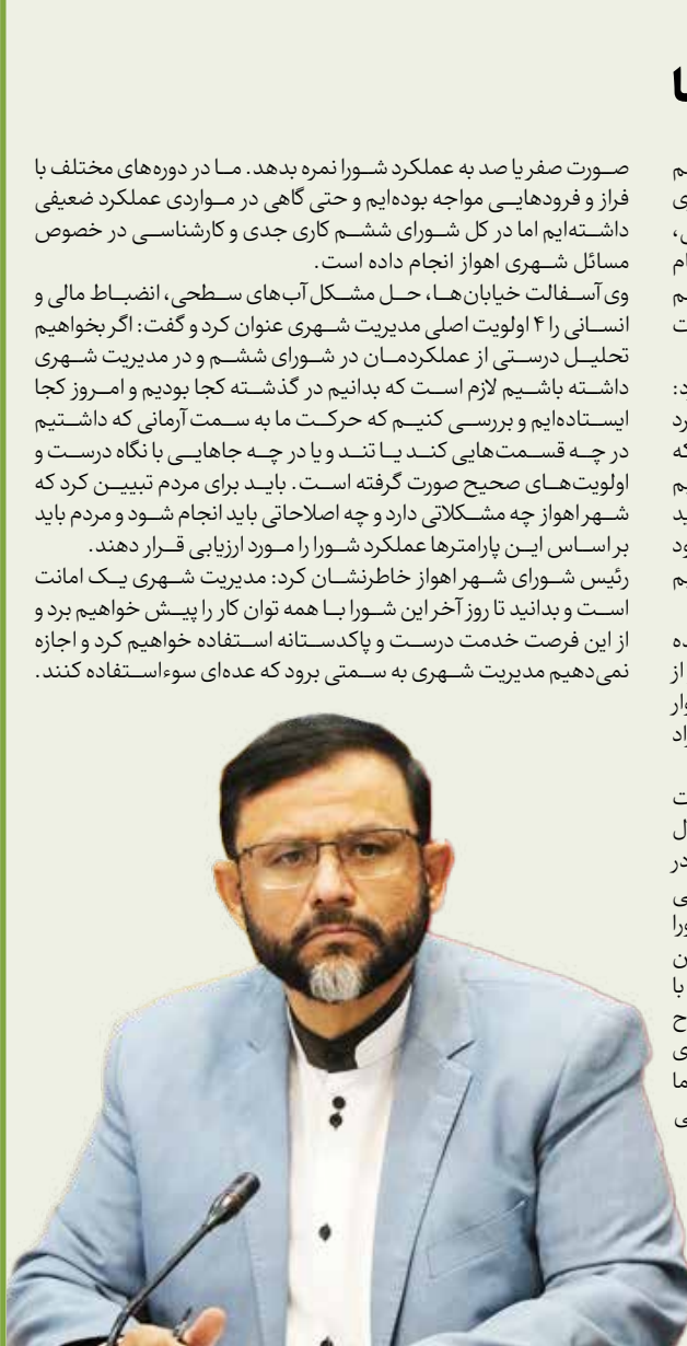
رئیس شورای شهر اهواز خاطرنشان کرد: هیچ کس نمی‌تواند به