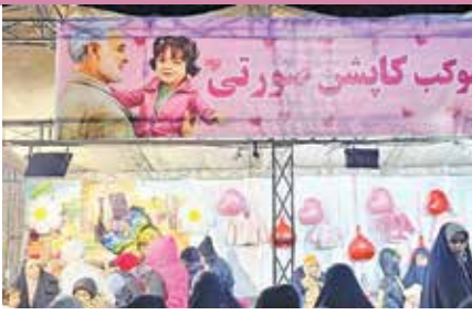
موکب کاپشن صورتی

شد، همان طور که اکنون به عنوان نام موکب شناخته می‌شود. این موکب نه تنها برای بزرگسالان، بلکه برای کودکان برنامه‌هایی ویژه دارد. یکی از خدمات برجسته این موکب، قصه‌گویی برای کودکان است. دنیای تخیل و داستان‌های کودکانه در این فضا زنده می‌شود. کودکان دور هم جمع می‌شوند و در این دنیای فانتزی