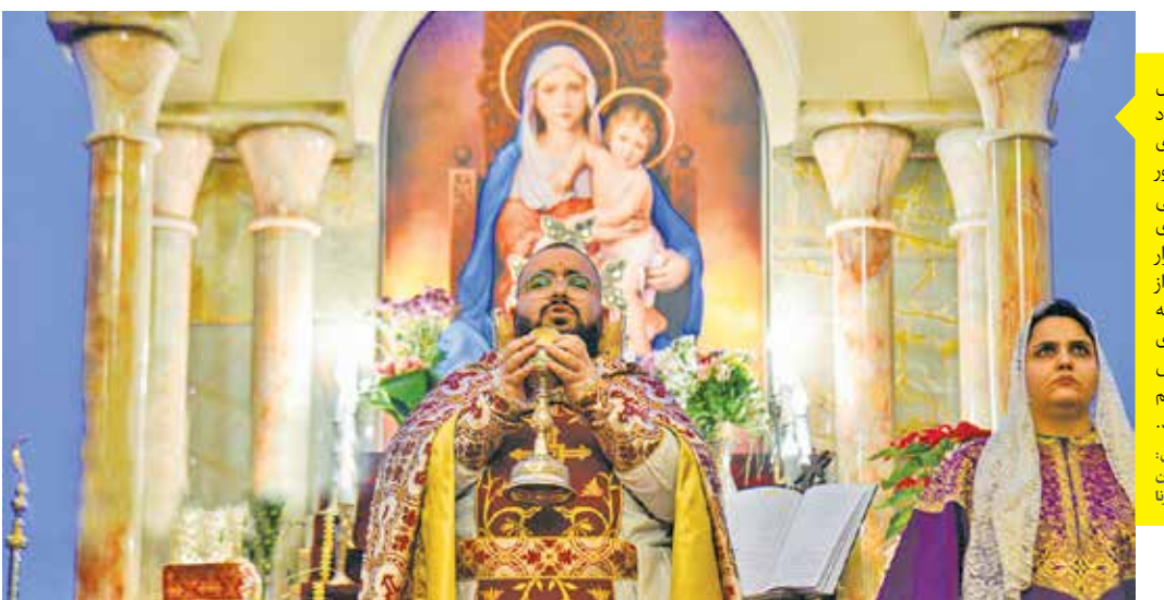
مراسم آغاز سال نو میلادی، یامداد چهارشنبه ۱۲ دی ۱۴۰۳ با حضور هموطنان مسیحی در کلیساهای سراسر کشور برگزار شد. جمعی از هموطنان آرامنه هم در کلیسای سرکیس مقدس تهران گرد هم آمدند.