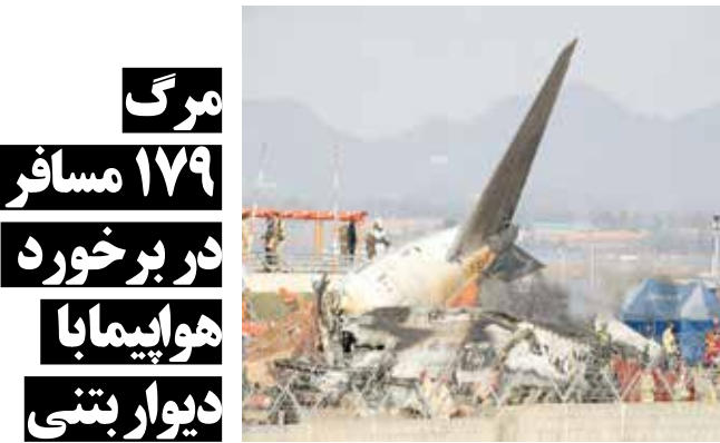
مرگ ۱۷۹ مسافر در برخورد هواپیما با دیوار بتنی

هواپیمای بوئینگ ۷۳۷-۸۰۰ در حال بازگشت از شهر بانکوک تایلند به فرودگاه شهر موان در حدود ۲۹۰ کیلومتری جنوب سئول بود که این حادثه رخ داد. امدادگران توانستند دو نفر از خدمه را نجات دهند که به گفته مقامات محلی، هوشیار هستند.