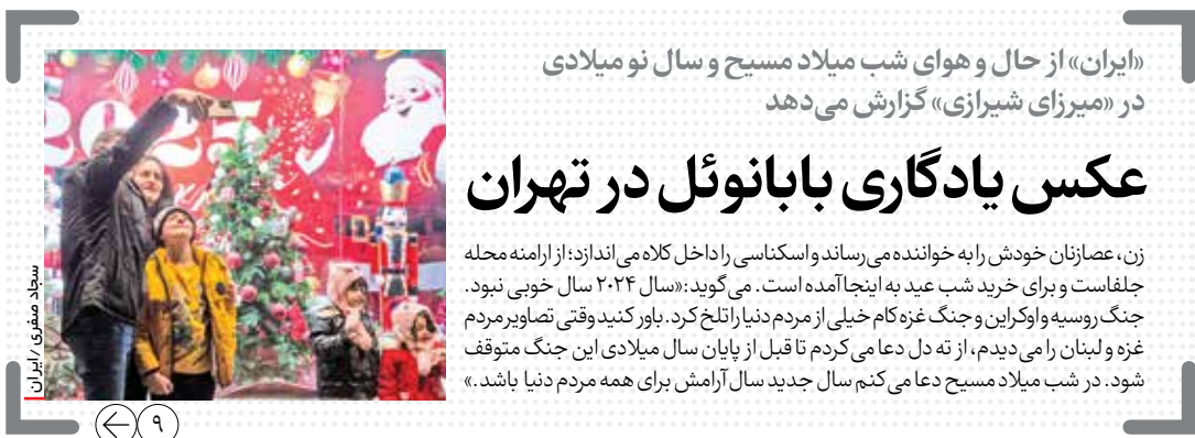
«ایران» از حال و هوای شب میلاد مسیح و سال نو میلادی در «میزرای شیرازی» گزارش می دهد