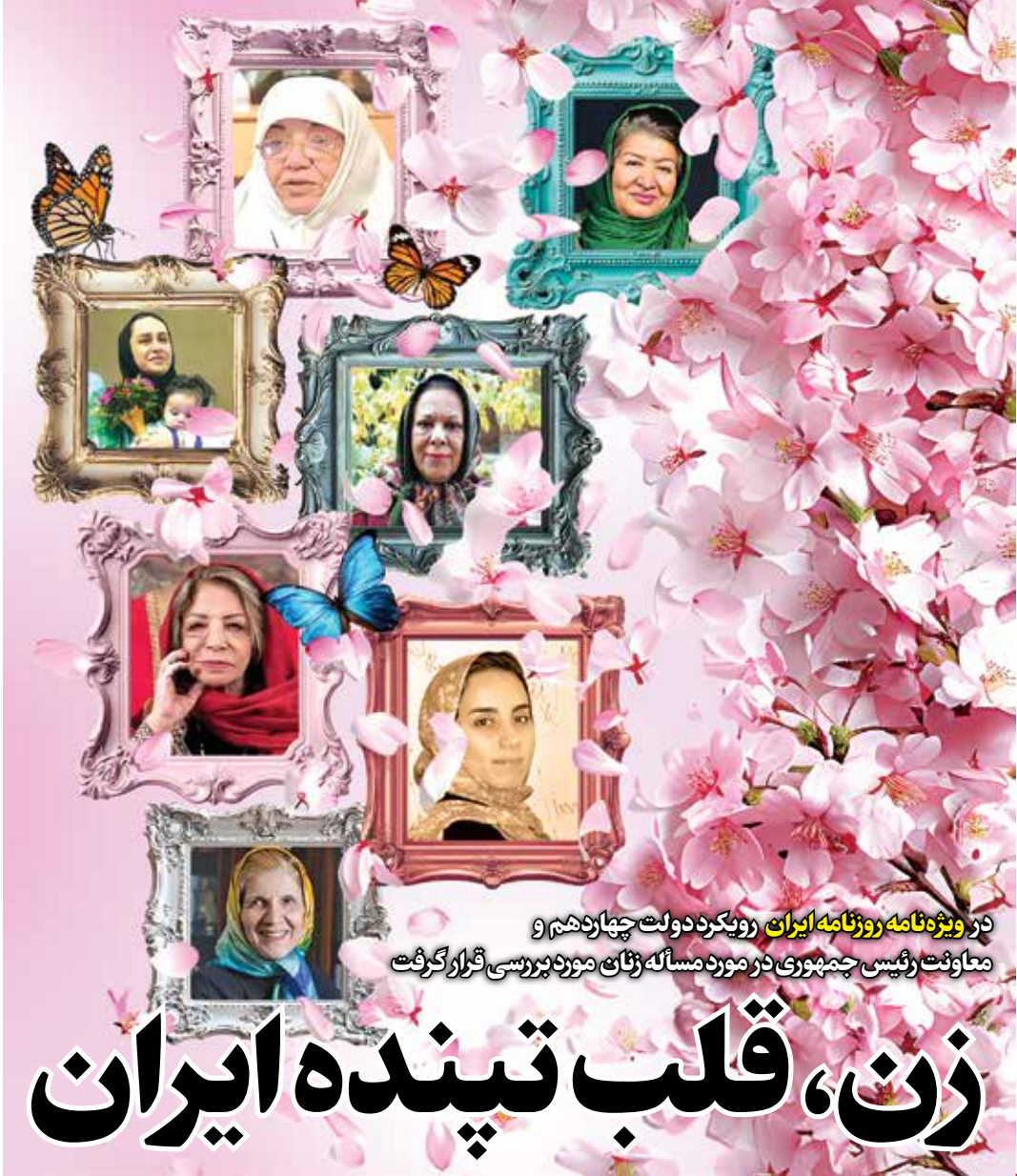
روز ویژه نامه روزنامه ایران رویکرد دولت چهاردهم و معاونت رئیس جمهوری در مورد مسأله زنای مورد بررسی قرار گرفت

دولت به دنبال راه های جایگزین برای رفع فیلترینگ