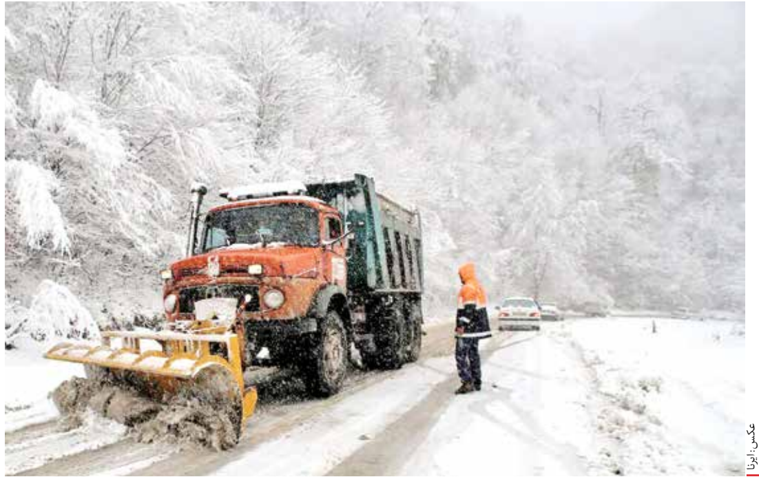
تاریخ انتشار: ۱۳۰۳/۱۲/۲۴

احتمال انسداد گردنه‌های برفگیر، طغیان رودخانه‌ها، مه‌گرفتگی و کاهش دید و آب‌گرفتگی معابر شهری