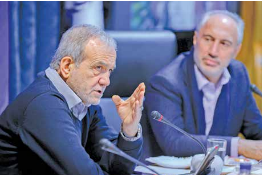
رئیس‌جمهور ایران، علی خامنه‌ای (راست) در دیدار با رئیس‌جمهور سابق، مهدی کروبی (چپ).