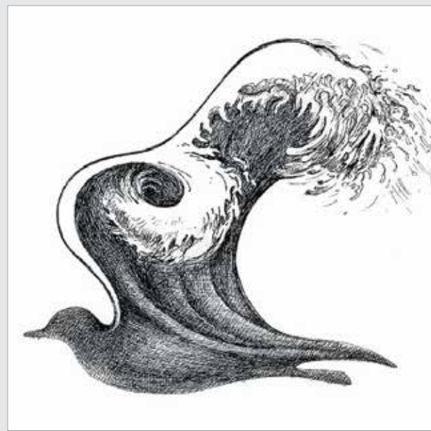
طراح: نوری نجفی