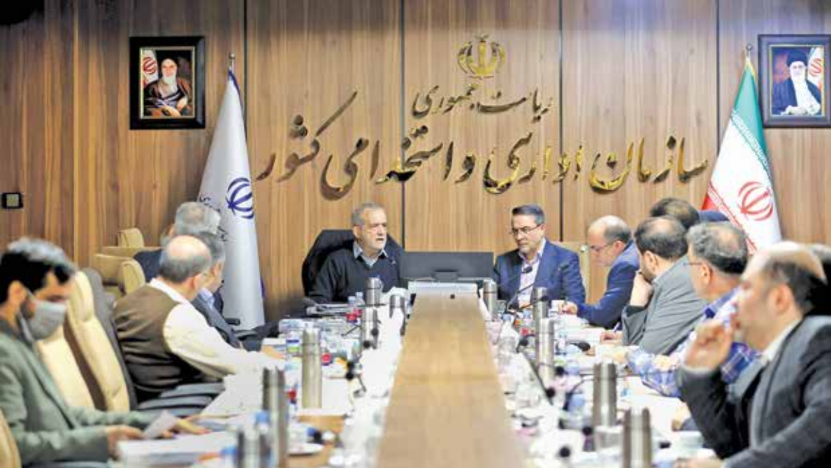
عزیز - President.ir