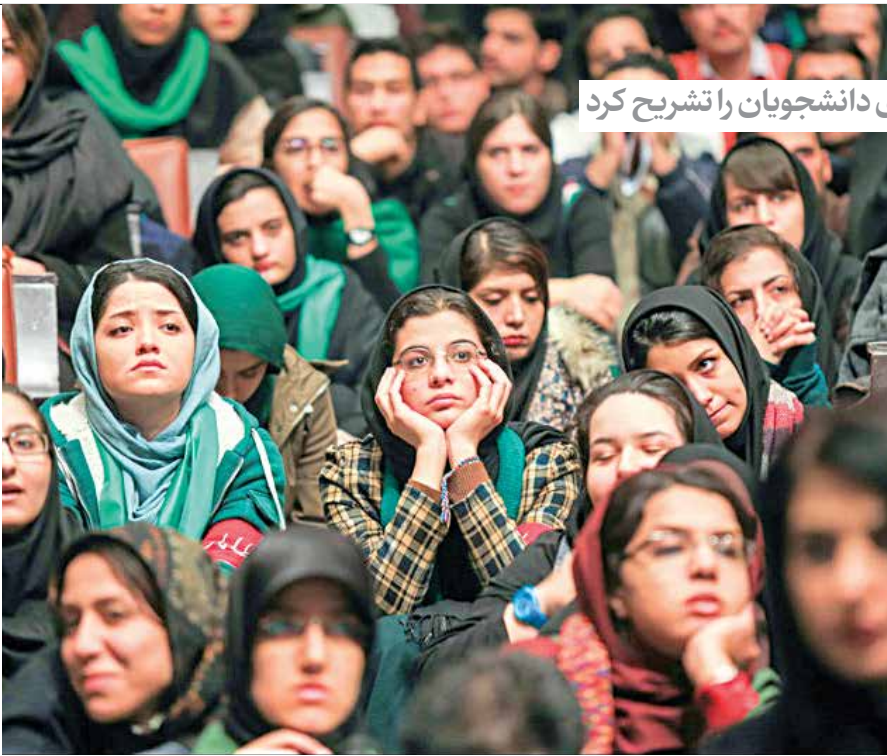
رئیس سازمان امور دانشجویان در گفت و گو با «ایران» برنامه های وزارت علوم برای دانشجویان را تشریح کرد

وی با بیان اینکه دانشگاه باید امن باشد ولی امنیتی