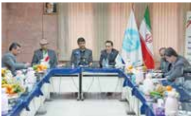
دستور وزیر ارتباطات به همه معاونان وزارتخانه