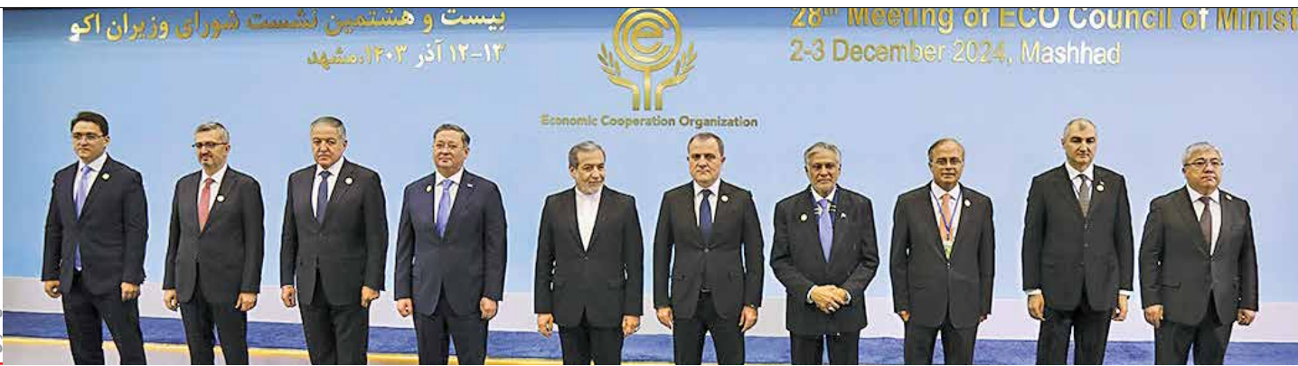
بیست و هشتمین اجلاس شورای وزیران امور خارجه روز گذشته به میزبانی ایران در شهر مشهد برگزار شد