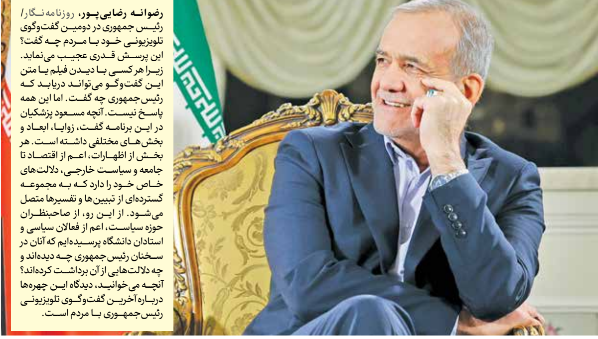
رضوانه رضایی پور، روزنامه‌نگار/ رئیس‌جمهوری در دومین گفت‌وگوی تلویزیونی خود با مردم چه گفت؟ این پرسش قدری عجیب می‌نماید. زیرا هر کسی با دیدن فیلم یا متن این گفت‌وگو می‌تواند دریابد که رئیس‌جمهوری چه گفت. اما این همه پاسخ نیست. آنچه مسعود پزشک‌ها در این برنامه گفت، زوایا، ابعاد و بخش‌های مختلفی داشته است. هر بخش از اظهارات، اعم از اقتصاد تا جامعه و سیاست خارجی، دلالت‌های خاص خود را دارد که به مجموعه گسترده‌ای از تبیین‌ها و تفسیرها متصل می‌شود. از این رو، از صاحب‌نظران حوزه سیاست، اعم از فعالان سیاسی و استادان دانشگاه پرسیده‌ام که آنان در سخنان رئیس‌جمهوری چه دیده‌اند و چه دلالت‌هایی از آن برداشت کرده‌اند؟ آنچه می‌خوانید، دیدگاه این چهره‌ها درباره آخرین گفت‌وگوی تلویزیونی رئیس‌جمهوری با مردم است.

در هنگام گفت‌وگو، بالای سر رئیس‌جمهوری، تابلویی با آیه‌ای از قرآن قرار داشت که قابل تأمل بود. آن آیه این بود: «والذی جاء بالصدق و صدق به اولئک هم الممتقون»؛ اما کسی که سخن صدق بیاورد و کسی که آن را تصدیق کند از پرهیزگارزند. این آیه راهنمای زندگی مدیریتی آقای پزشک‌ها است و در این گفت‌وگو به نیکی نشان داد که پایبند به این آیه شریفه است. دکتر پزشک‌ها حالا در قامت یک مدیر عالی‌رتبه ظاهر می‌شود و تمامی گفتار و کردار آن گواه آن است که به همه شعارهای خود پایبند است و قرار را بر این گذاشته که با همه نیروها و ظرفیت موجود کشور اعم از چپ و راست و اصلاح‌طلب و اصولگرا و کسانی که معاند نبوده‌اند همکاری کند. ایشان بار دیگر ثابت کرد که برای نشان دادن در باغ سبز به برخی از طرفداران خود حاضر نیست زیر بار وعده‌های تو خالی برود.