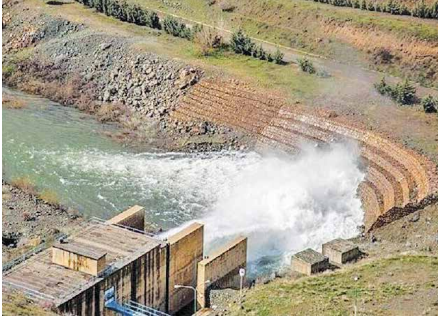
سد آزاد در استان کردستان. در این تصویر، سد آزاد در استان کردستان دیده می‌شود.

به گفته معاون هماهنگی امور عمرانی استاندار کردستان چند مسأله حقوقی در ارتباط با تعارض منافع و معارضینی که در مسیر کمربندی غربی شهر دهگلان وجود داشت، مانع از رسیدن آب به تصفیه‌خانه دهگلان شد.