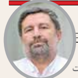
الیاس حضرتی رئیس شورای اطلاع‌رسانی دولت

صحت از وفات با مردم کرده و شعار دولتش را هم «وفات ملی» انتخاب می‌کند. رئیس‌جمهوری پزشک‌ها از همان ابتدای آغاز به‌کار دولت با همان اراده راسخ و عزم جدی همیشگی، تلاش کرده تا «شعار وفات» را به واقعیت وفات تبدیل کند. ایشان در اولین سخنرانی خود در مجلس برای رای اعتماد به وزرا، با تأکید بر ضرورت اعتماد به کابینه کامل، نمایندگان را قانع کرد که دولت بدون همکاری و همراهی قوای دیگر، قادر به شناسایی و حل ریشه‌ای مشکلات کشور نخواهد بود. این نگاه به وفات باور دارد. روزی به‌عنوان یک روزمنده در شد، جایی که رئیس‌جمهوری تصریح کرد دولت تحت هدایت و حمایت مقام معظم رهبری و با همدلی سایر قوا، مصمم به کاهش