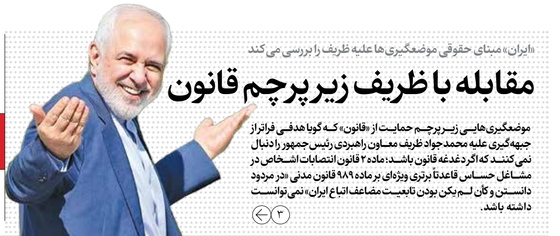
«ایران» مبتنی حقوقی موضعگیری ها علیه ظریف را بررسی می کند