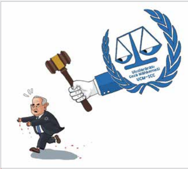
طراح: Mikail Ciftci