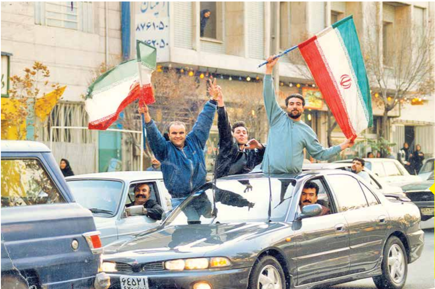
هشت آذر ۷۶ روزی که مردم شادی ملی را تجربه کردند. تسایوی ایران و استرالیا و راهبایی ایران به جام جهانی ۱۹۹۸ فرانسه موجهی از شادی ایران را در برگرفت و همه مردم از فوتبالی و غیر فوتبالی به خیابان‌ها آمدند و شادی را از ته دل تجربه کردند.

هروقت یکی می‌گیرید، دیگری می‌خندد. دوست عزیز، این قانون عالم است؛ رمز کمال همه‌جانبه آن است. اگر غریز از گریه چیزی در میان نباشد، حاصل بکنواختی محض است و اگر جز خنده چیزی نشوی خسته‌کننده است. کینکاس یوریا ماشادو داسیس