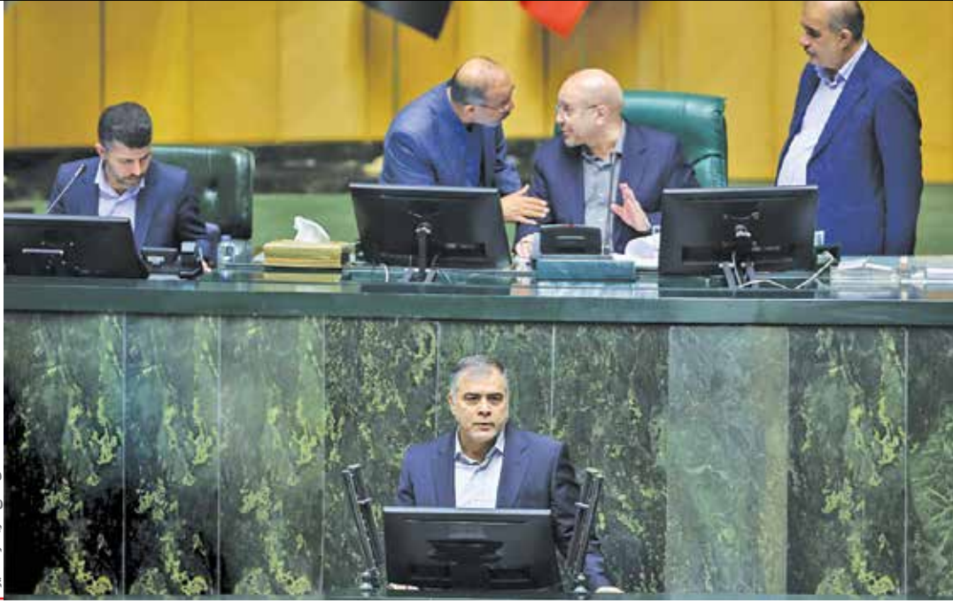
وضعیت ذخایر مازوت نیروگاه‌ها در دوسال اخیر و ۷ ماهه نخست سال ۱۴۰۳

روایت رئیس مجلس از ناترازی انرژی و از دست رفتن اهرم‌های استراتژیک کشور در حوزه انرژی در نوع خود روایتی قابل توجه بود. محمدباقر قالیباف با اعلام اینکه در حوزه گاز در زمستان ۱۴۰۲، ۲۵۰ میلیون متر مکعب ناترازی انرژی وجود داشته و تبعاتی همچون افت فشار و تعطیلی صنعت را (از جمله به دلیل قطع برق در بخش صنعتی) به همراه داشته، گفت: زمانی بود که در مواجهه با تهدیدات دشمنان می‌گفتیم نفت را روی شما می‌بندیم و اهرم تهدید ما