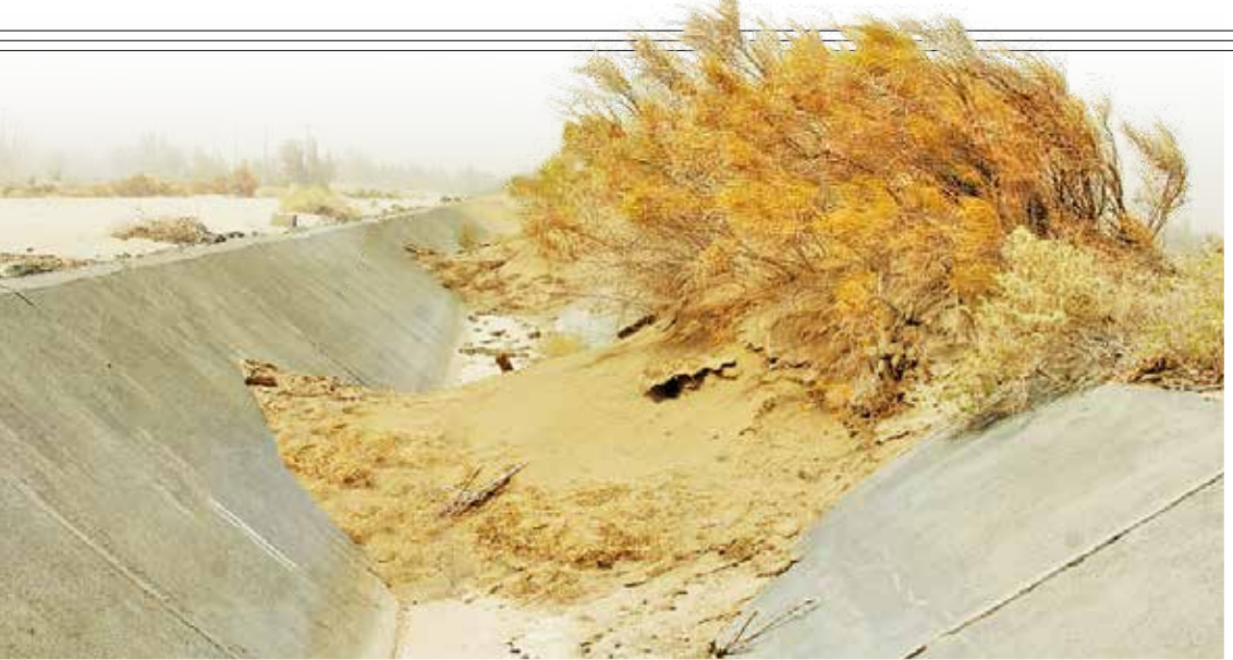
مشکل در سد کمال خان

معاونت علمی ریاست جمهوری چه می‌گوید؟ نتیجه‌آزمین مطالعات صورت گرفته توسط معاونت علمی، فناوری و اقتصاد دانش‌بنیان ریاست جمهوری نشان می‌دهد، راه‌سازی حوضه زراعت و