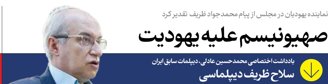
نماینده یهودیان در مجلس از پیام محمد جواد ظریف تقدیر کرد