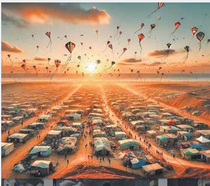
طراح: Awni Eshtaiwe