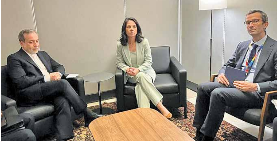
دیدار عراقچی و وزیر خارجه آلمان در حاشیه مجمع عمومی سازمان ملل

آنجده امروز از بطن رابطه پرفراز و فرود ایران و پابخت‌های اروپایی به ضمیر ناخودآگاه تاریخ متبادر می‌شود، گزاره مهم اهمیت «بازی در حیاط بزرگان» است؛ گزاره‌ای که نقش تاریخی «شارل موریس دو تالیان»، وزیر مملوخلو ناپلئون بناپارت در کنگره وین ۱۸۱۴ و طوفانی را که در این نشست به پا کرد، یادآور می‌شود آن‌هم در حالی که در میان نمایندگان کشورهای سرمست از پیروزی هیچ پشوتوانه‌ای نه در زمین جنگ و نه در وضعیت سیاسی پایتخت فرانسه داشت و نه حتی کارت دعوتی برای حضور در کنفرانس وین با خود به همراه برده بود، اما در همنشینی بزرگان قدرت حضور یافت و یکتانه در برابر آنها ایستاد. این یک یادآوری تاریخی است که اروپای امروز در مواجهه با ایران که پس از ماجرای «میکونوس» تا امروز زاینده بحرانی بی‌سابقه شده است، باید برای خود تکرار کند. اما چرا؟