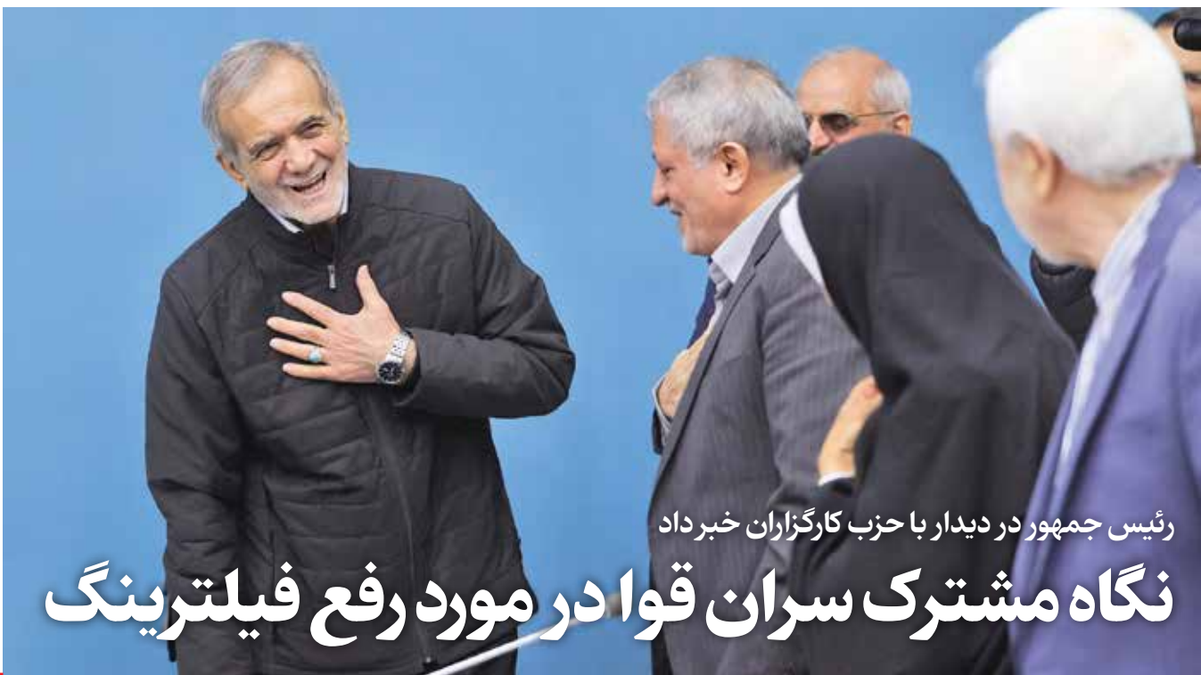
رئیس‌جمهور در دیدار با حزب کارگزاران خبر داد