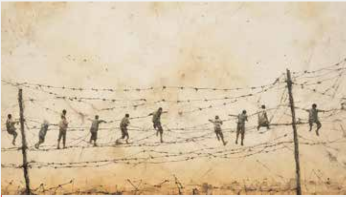
طرح: Hazim Bitar