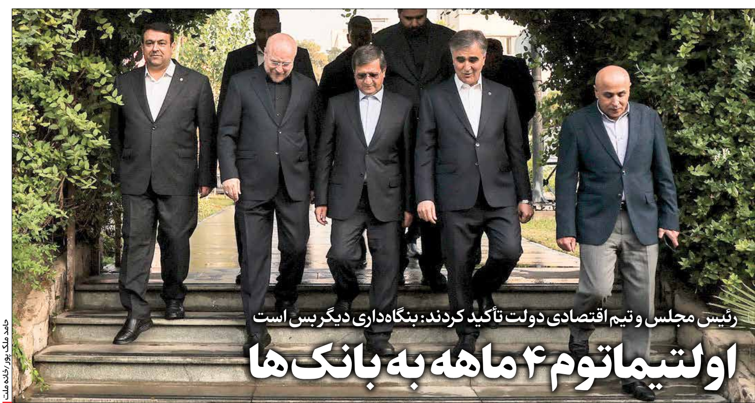
رئیس مجلس و تیم اقتصادی دولت تأکید کردند: بنگاه‌داری دیگر بسی است اولتیماتوم ۴ ماهه به بانک‌ها