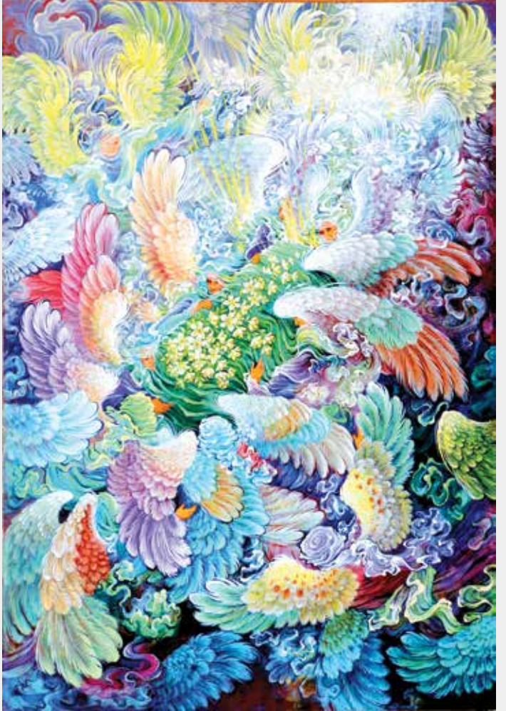
طرح: رضا بدرالسمّا