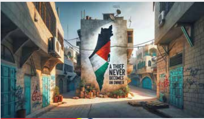
طراح: Awni Eshtaiwe