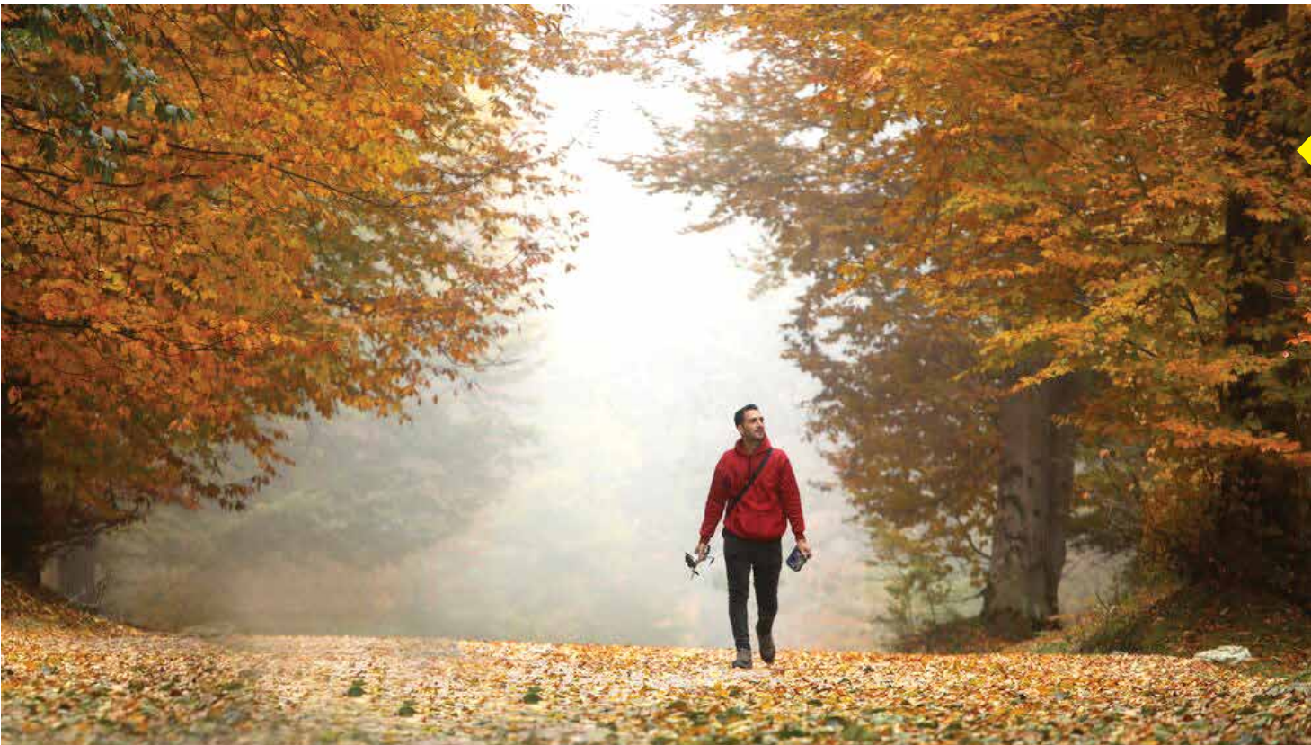
فریم صحرائیکی از بخش‌های دودانگه از توابع شهرستان ساری در استان مازندران است. زیبایی این منطقه به جنگل‌هایی است که آن را از شمال و جنوب در بر گرفته‌اند. جنگل بولا بخشی از جنگل‌های هیرکانی است که در دامنه شمالی رشته‌کوه‌های البرز (دامنه جنگلی قله خرونور) قرار گرفته و از قدیمی‌ترین جنگل‌ها در دنیا به شمار می‌آید. منطقه فریم صحرا دودانگه، در ارتفاع ۹۰۰ متری از سطح دریا قرار گرفته است.