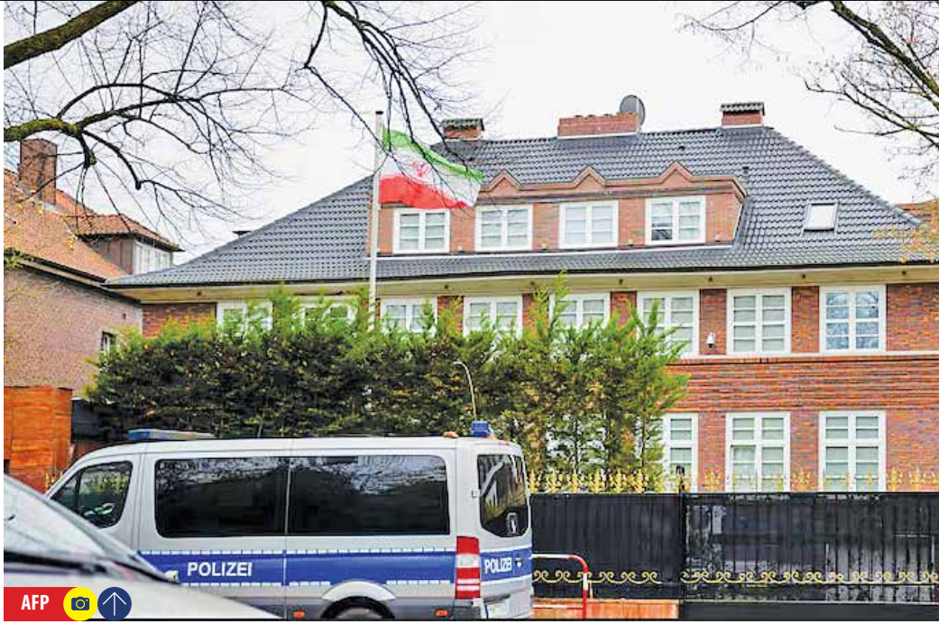
«ایران» ابعاد تشدید بحران دیپلماتیک میان جمهوری اسلامی و اتحادیه اروپا را بررسی می کند