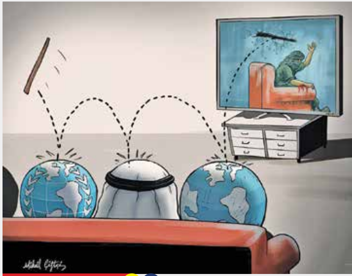
تراج: Direniş Dalgası

لحظه های آخرت تلفیق شعر و جنگ بود ای شهید معرکه مردن برایت ننگ بود چوب در دست تو را چوب خدا دیدیم ما بی صدا بر شیشه شب خورد؛ گویا سنگ بود شاعر: محمد رسولی