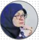
مهاجرانی سخنگوی دولت شرط تصمیم‌گیری درباره بنزین