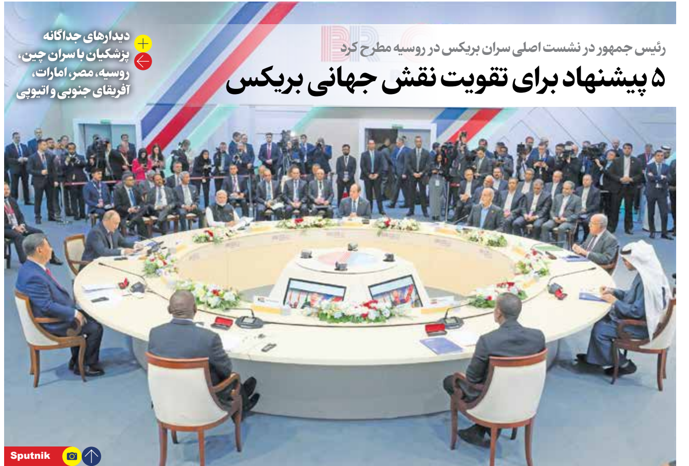
دیدارهای جداگانه بزرگیان با سران چین، روسیه، مصر، امارات، آفریقای جنوبی و اتیوپی