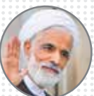
انصاری معاون حقوقی رئیس جمهور مقابله با ادعاهای امارات

دیروز در حاشیه جلسه هیأت وزیران، پرکارترین پرسش خبرنگاران از اعضای دولت، پرسش درباره جزایر سه‌گانه بود. اعضای دولت با تأکید و نیز با تکیه بر مستندات تاریخی و بین‌المللی، تصریح کردند که این جزایر برای همیشه در مالکیت ایران خواهد بود و ادعاهای مطرح شده هیچ توجیه سیاسی و تاریخی ندارد و صرفاً یک ادعای رسانه‌ای است. گزارش این رویداد را در صفحه‌های «ایران» بخوانید.