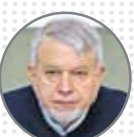
صالحی امیری وزیر گردشگری تغییر غیرسلیقه‌ای مدیران