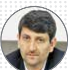
هاشمی وزیر ارتباطات و فناوری اطلاعات پیگیری با جدیت رفع فیلترینگ