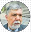
صالحی وزیر فرهنگ و ارشاد اسلامی خبر خوش درباره رفع ممنوع‌الکاری‌ها