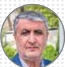
اسلامی رئیس سازمان انرژی اتمی آمادگی پاسخ به تعرض دشمن