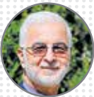
مؤمنی وزیر کشور امکان پذیرش اتباع را نداریم