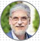
سیمایی صراف وزیر علوم، تحقیقات و فناوری پیگیری وضعیت دانشجویان اخراجی